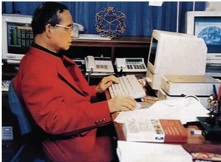
พระบาทสมเด็จพระเจ้าอยู่หัว พระผู้ทรงเป็นแรงบันดาลใจในการใช้คอมพิวเตอร์และอินเทอร์เน็ตพัฒนาคุณภาพชีวิตผู้สูงอายุ His Majesty King Bhumibol Adulyadej: An inspiration to the older population to improve their quality of life with modern technology

ณ ห้องปฏิบัติการคอมพิวเตอร์ ชั้น 5 โรงแรมสวนดุสิต เฟส เฟส 2 มหาวิทยาลัยราชภัฏสวนดุสิต กรุงเทพมหานคร May 30, 2009, at Computer lab (seminar room), 5 th Fl., Suan Dusit Place phase 2, Suan Dusit Rajabhat University, Bangkok Metro, Kingdom of Thailand