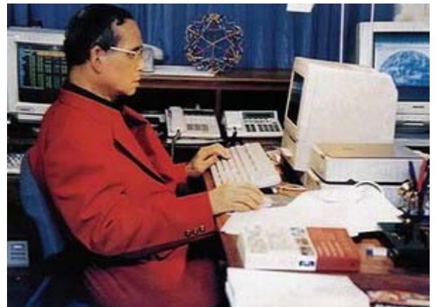
พระบาทสมเด็จพระเจ้าอยู่หัว พระผู้จุดประกาย วงการคอมพิวเตอร์ในประเทศไทย

ทัดเทียมประเทศที่เจริญแล้ว นับได้ว่า “ทรงเป็นผู้นำและจุดประกายวงการคอมพิวเตอร์ในประเทศไทยอย่างจริงจัง” (ศรีศักรดิ์ จามรมาน, 2542: 66)